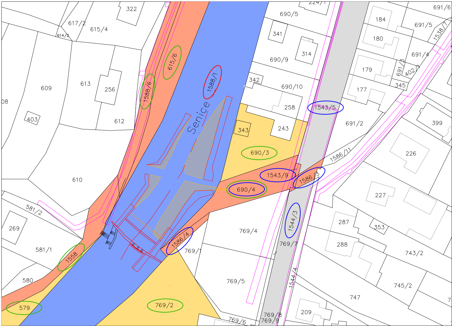
SO 01 - stupeň Ústí